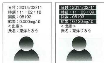
写真付き検査結果出力